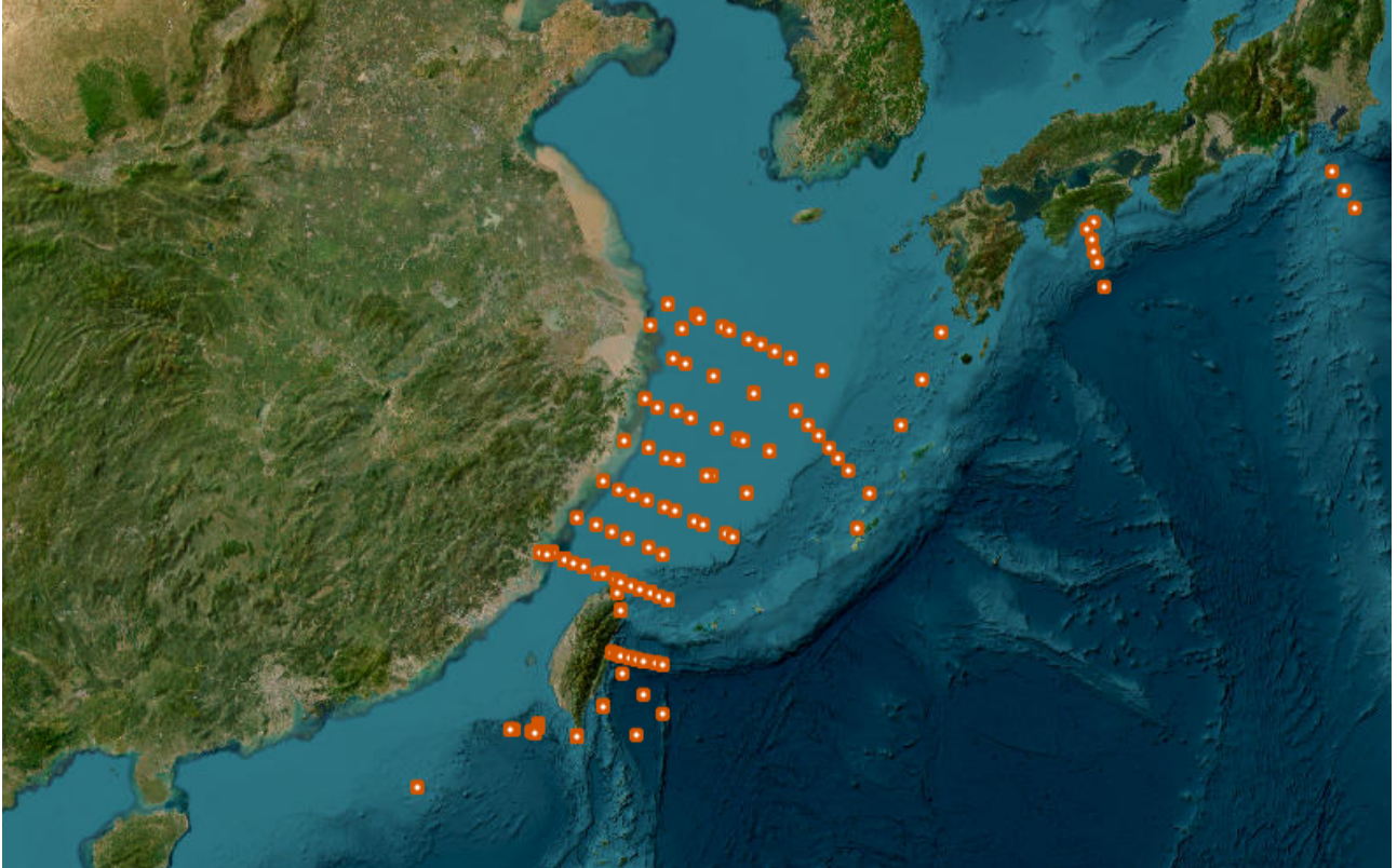
圖 1、MDB 樣本點位地圖。

在資料庫內容部分，目前 MDB 資料庫已蒐集整理近期海洋研究船發表的相關文獻，收錄了發表於 2014-2025 期間的 18 個專案，共計 686 站點及 1,348 樣本。其中的樣本來源類型(source type)包括：海水、沉積物、珊瑚骨骼、螃蟹、海岸疊層石等；採樣地區包括：臺灣近海、東海、小東海、臺灣黑潮區、南海、日本黑潮區等，如下圖 1 所示。