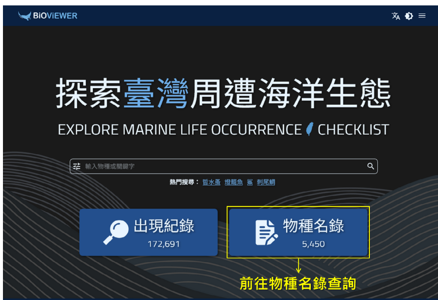
圖 6、從首頁進入物種名錄查詢功能。

在新版的首頁點選「物種名錄」按鈕（圖 6），進入查詢頁面可以看到有兩個設定窗格「① 區域設定」和「② 參數設定」，以及最下方的「③ 送出查詢」按鈕。