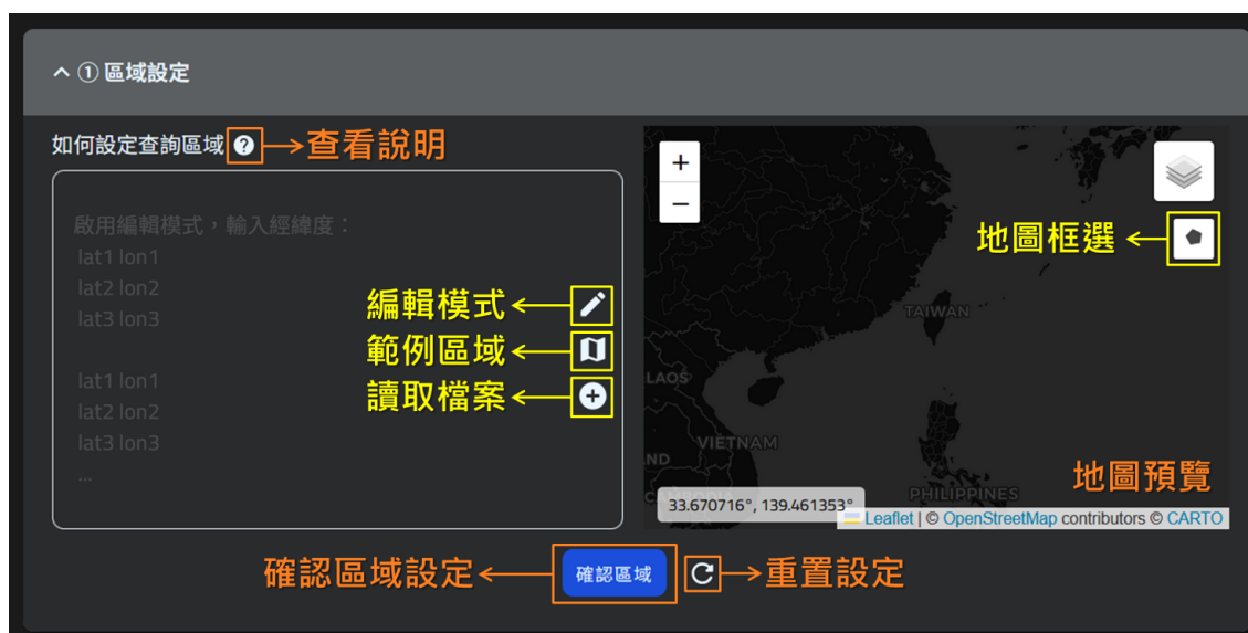
圖 7、物種名錄查詢區域設定。

區域設定提供「編輯模式」、「地圖框選」、「範例區域」、「讀取檔案」四種方式指定查詢區域；如有操作疑問，可以開啟窗格上方的「說明」查看注意事項與檔案格式限制（圖 7）。接著來到參數設定窗格中，調整年份、主題、季節等進階條件（非必須）。上述兩步驟，都需記得點下「確認區域」與「確認參數」按鈕完成設定。最後，點選頁面底部的「送出查詢」跳轉至結果頁。